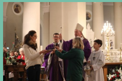
Bénédiction du santon Porcaro.