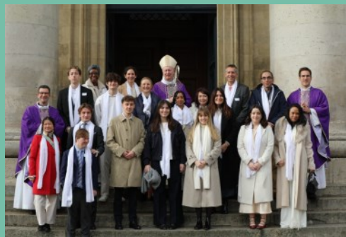
Avec les confirmands.