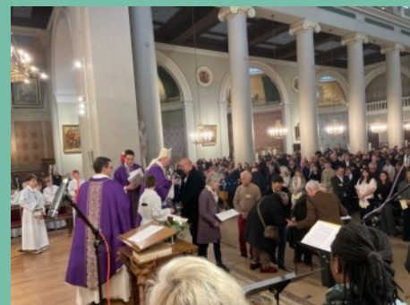
Remise des médailles de Saint-Louis