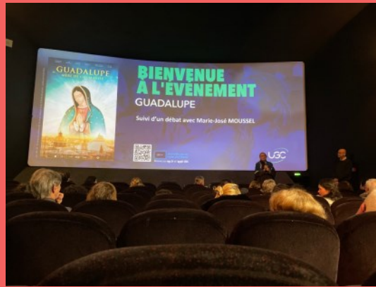
Projection du film GUADALUPE, Mère de l'Humanité.