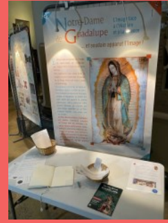
Exposition dans le déambulateur.