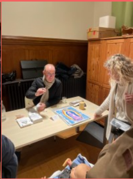
Par le père Pascal Nègre.