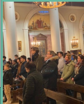
Célébration de la messe avec les jeunes

A u cours de sa visite pastorale fort rythmée, Mgr Crepy n'a pas oublié les étudiants ! On n'attrape pas les mouches avec du vinaigre (comme disait saint François de Sales), alors c'est dans un bar que la rencontre s'est faite, autour d'une bière. Les jeunes ont trouvé ainsi l'occasion d'échanger avec leur évêque sur leur vie spirituelle, et d'exprimer leurs attentes en termes de pastorale étudiante à Saint-Germain.