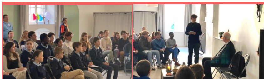
Ci-contre, échange avec les jeunes d'écoles catholiques