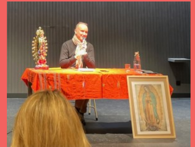
Conférence salle Sainte-Anne.