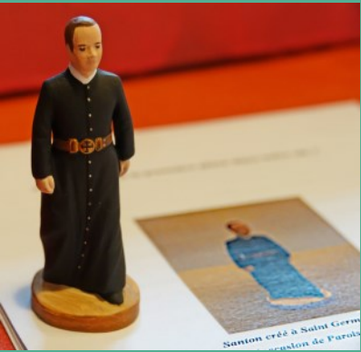
P. Pierre de Porcaro santonnifié.