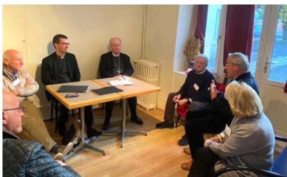
Avec les responsables de l'accueil de nuit