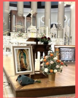
Messe célébrée en espagnol.