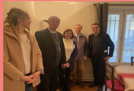
Avec la communication